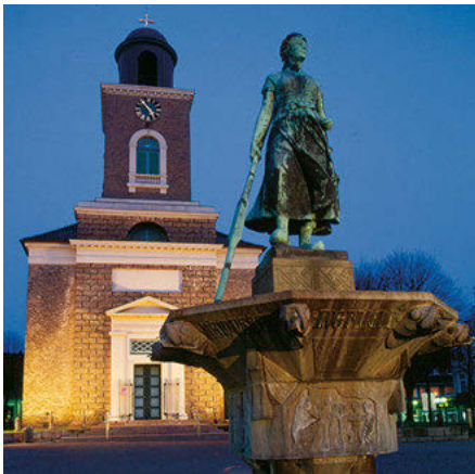
Die „Tine“ mit der Marienkirche im Hintergrund

An der Ostseite des Marktes steht die St.-Marienkirche (7, C 3): ein klassizistischer Bau von hohem kunstgeschichtlichem Rang. Der jetzige Bau wurde zwischen 1829 und 1832 errichtet und ersetzte die