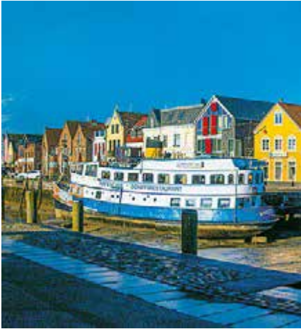
Blick auf den Binnenhafen